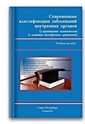
Современные классификации заболеваний внутренних органов