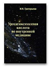
Урсодезоксихолевая кислота во внутренней медицине