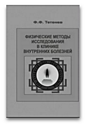
Физические методы исследования в клинике внутренних болезней