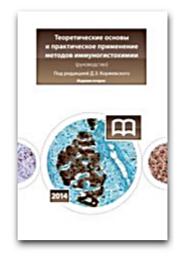
Теоретические основы и практическое применение методов иммуногистохимии