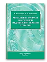
Актуальные вопросы неотложной медицинской помощи в терапии

- Теперь Вы прикреплены к институту и имеете доступ к подпискам института и к полному функционалу своего личного кабинета.