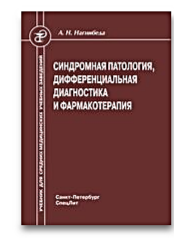
Синдромная патология, дифференциальная диагностика и фармакотерапия